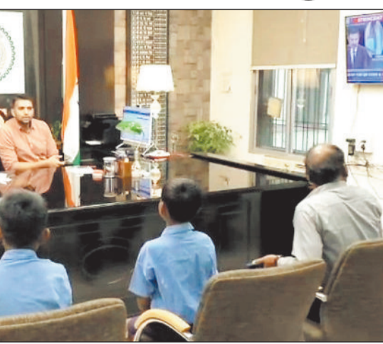
दोनों बाल वीरों की बहादुरी की प्रशंसा करते हुए कहा कि ऐसे साहसी बच्चे हमारे समाज के लिए प्रेरणा हैं। कलेक्टर ने दोनों बच्चों के नाम राज्य वीरता पुरस्कार हेतु प्रस्ताव भेजने के निर्देश संबंधित विभाग के अधिकारी को दिए।

दोनों बच्चों को मिलेगी साइकिल मुलाकात के वक्त कलेक्टर ने दोनों बच्चों से स्नेहपूर्वक बातचीत करते हुए जब पूछा कि उन्हें क्या चाहिए, तो उन्होंने मासूमियत से साइकिल की मांग की। कलेक्टर ने मुस्कराते हुए कहा कुछ और मांगों तो बच्चों ने हिचकिचाते हुए साइकिल की मांग की। कलेक्टर ने दोनों को साइकिल देने संबंधित अधिकारियों को निर्देश दिया।